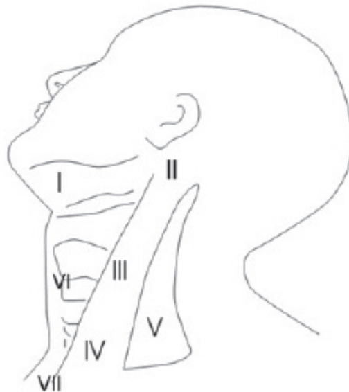
• FIGURA 1. LOCALIZACIÓN DE GANGLIOS CERVICALES DE ROBBINS (AMERICAN ACADEMY OF OTORHINOLARINGOLOGY & AMERICAN SOCIETY FOR HEAD AND NECK SURGERY): NIVEL I: GRUPO SUBMENTONIANO Y GRUPO SUBMAXILAR. NIVEL II: GRUPO YUGULAR ALTO. NIVEL III: GRUPO YUGULAR MEDIO. NIVEL IV: GRUPO YUGULAR INFERIOR. NIVEL V: GRUPO DEL TRIÁNGULO POSTERIOR. NIVEL VI: COMPARTIMENTO CENTRAL. NIVEL VII: REGIÓN DE MEDIASTINO SUPERIOR.

En la figura 1 se representan las distintas áreas ganglionares del cuello. El drenaje linfático de la glándula tiroidea generalmente es hacia el compartimiento central (área VI) y hacia las áreas laterales: II (yugulares superiores), III (yugulares medios), y IV (yugulares inferiores).